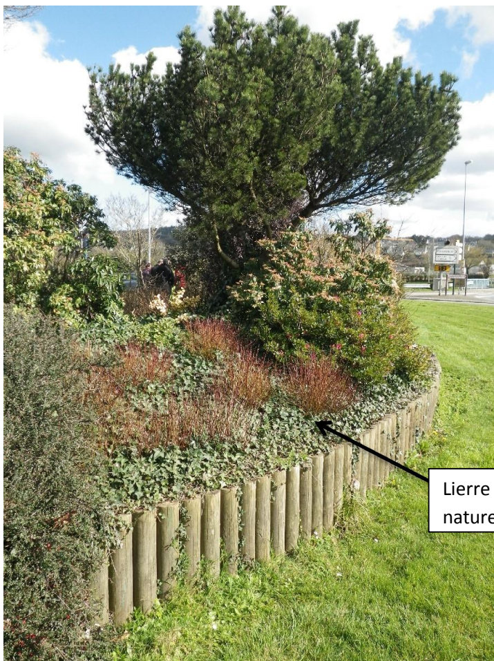
Lierre grim pant, implanté naturellement

Particularité : présence de fraisiers des bois , espèce qui est réapparue naturellement sur certains espaces verts de Landerneau suite à l'arrêt de l'usage des pesticides