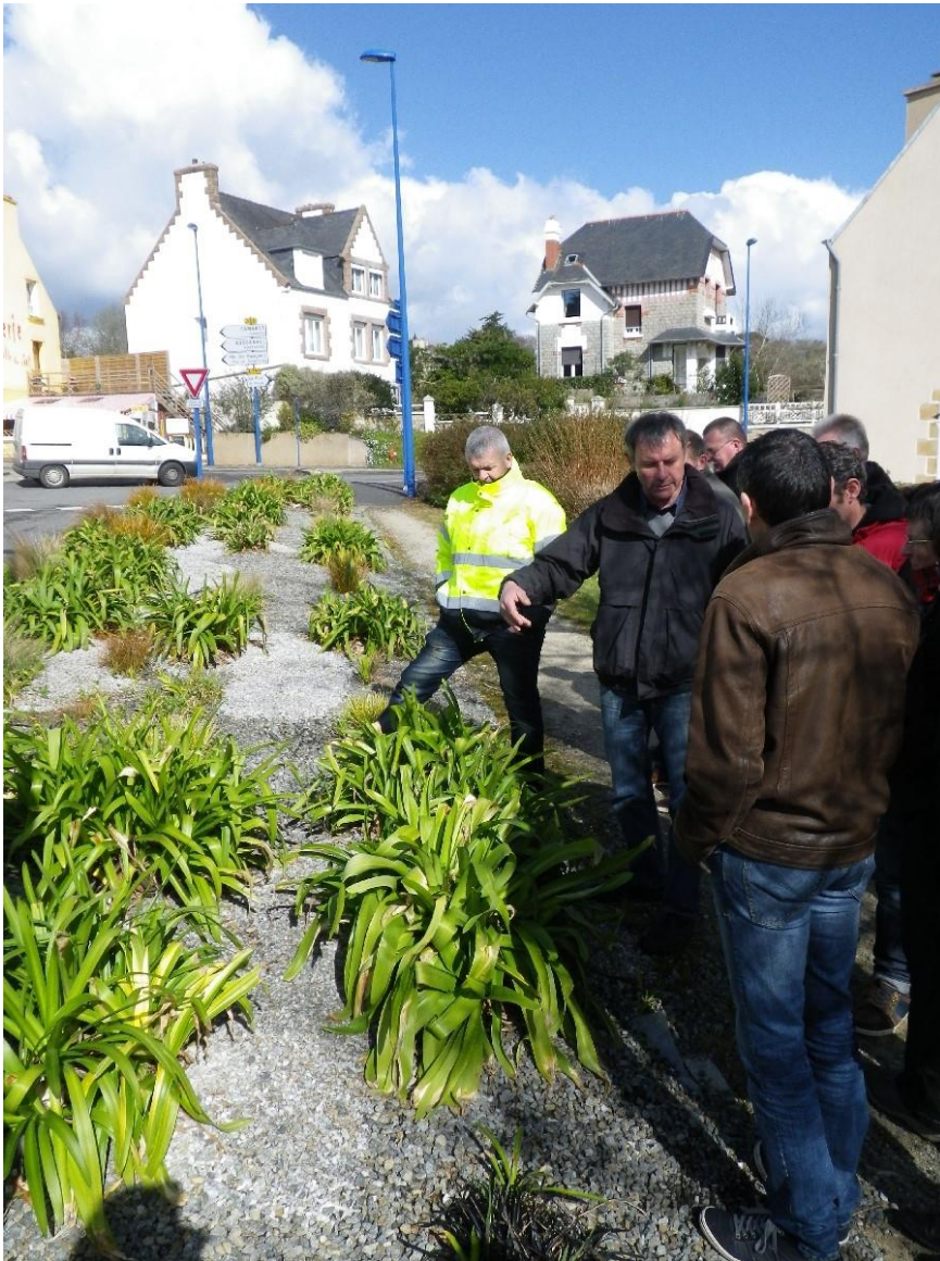
Agapanthes en fleur